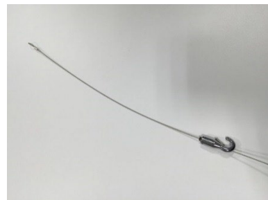
ワイヤーフック（見本）