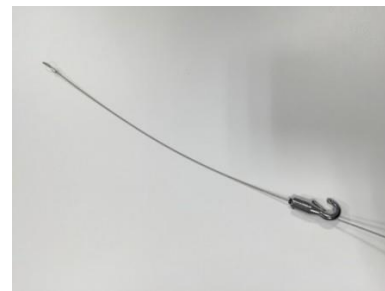
ワイヤーフック（見本）