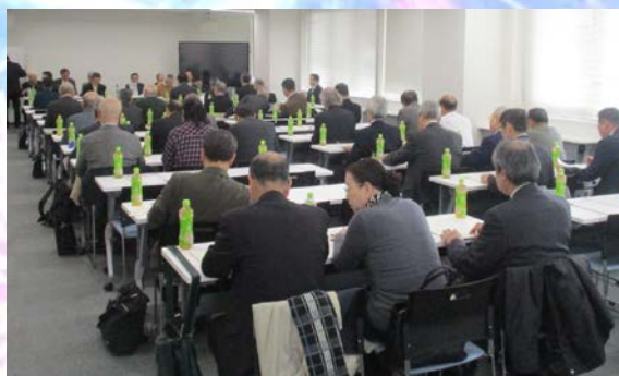
年3回開催される実行委員会の様子。 そのほか、花火部会、いきいきフェスタ部会なども。