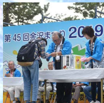
いきいきフェスタ、抽選会 役員の皆さんがプレゼンターです。