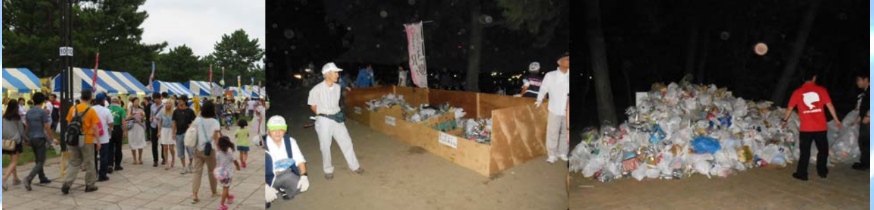
多くの飲食店が出店します。

花火大会では、飲食も楽しみの一つ♪ ですが、それに伴い大量のゴミも発生します。会場では、環境事業推進委員の皆様にご協力をいただいています。しかし、残念ながら砂浜などに放置されるゴミも…。