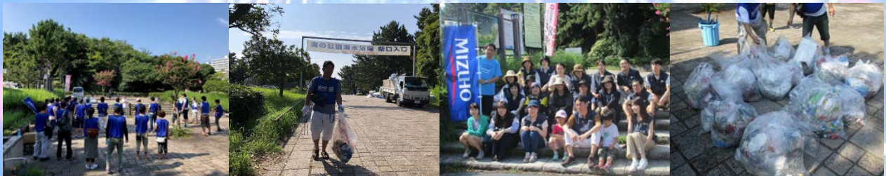
清掃活動を行う、清水建設(株)の皆様、(株)みずほ銀行の皆様。早朝の清掃活動は清々しい気持ちになります。

毎年、花火大会翌日の早朝には、清水建設(株)の皆様、(株)みずほ銀行の皆様、関東学院大学・横浜市立大学の皆様による、清掃活動が行われています。花火大会が終わった後も、綺麗な海の公園を保てるのは皆様のお陰です！