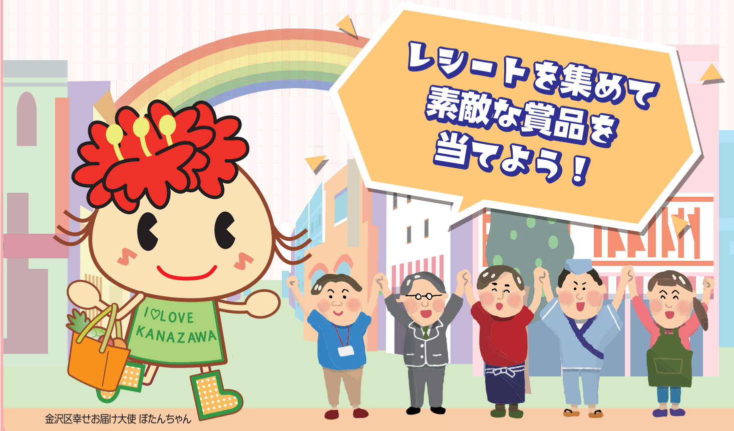
金沢区幸せお届け大使 ほたんちゃん