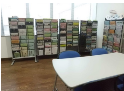
パンフレットコーナー