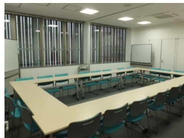
会議室 A・B(同時利用) 22 名定員