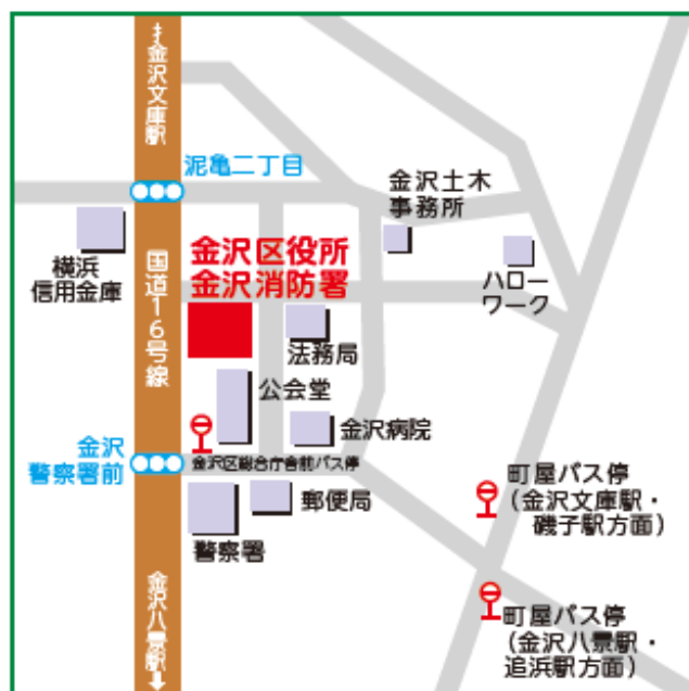
金沢区役所周辺拡大図