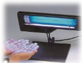
あなたの手はピカピカ？ 手洗いチェッカー