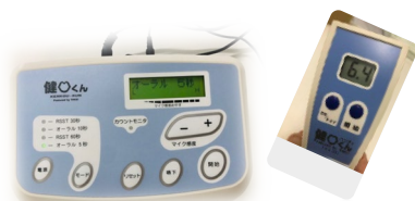
お口の機能のレベルがわかる 口腔機能測定器