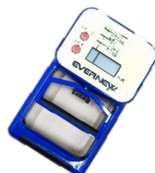
全身の筋力の強さの目安 握力計