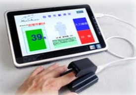
血管年齢は何歳？ メディカルアナライザー