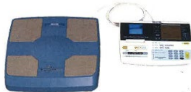
身体の中が丸わかり？ 体組成計