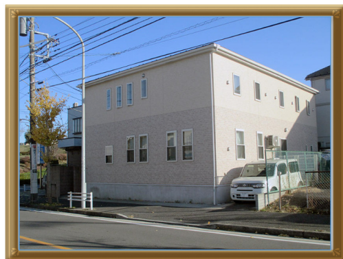
グループホーム ソラスト富岡外観

グループホームは施設ではなく、「認知症の方の下宿屋さん」と考えているのでご自身のペースで過ごして頂き、心地の良い場所を感じて頂ける様心掛けております。また、なるべく閉じこもらないように、外出することも大切にしています。天気が良ければ外に出て四季を感じたり、逆に居室にいたいという方にはお声がけだけして無理強いはしません。入居者様それぞれの、そのときのお気持ちに合わせて対応をしています。