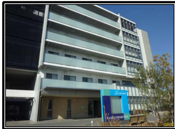
特別養護老人ホーム ラースール金沢文庫 外観