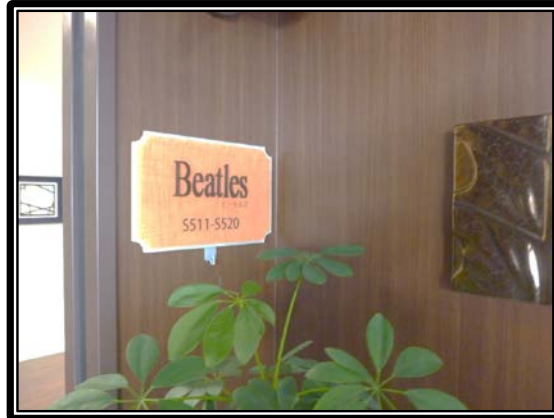
特別養護老人ホーム ラースール金沢文庫 フロア内観