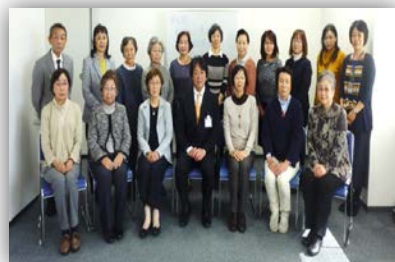
第5期介護相談員及び事務局