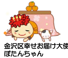
金沢区幸せお届け大使 ぼたんちゃん