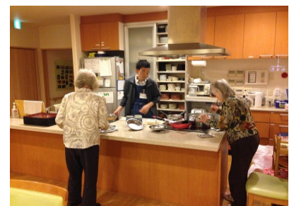
【入所者様の日常風景】