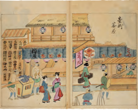
「金川砂子 台町茶屋」