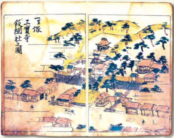
「神奈川駅中図会 一里塚三寶寺飯綱社之図」