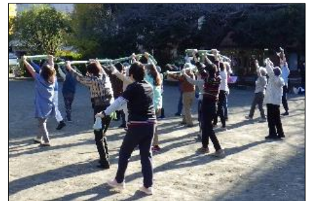
「かめ亀手ぬぐいサイズ」に取り組む様子

※フレイルとは…「健康」と「要介護状態」の“中間の状態”です。 早く気づいて予防することで、状態の維持・改善が期待できます。