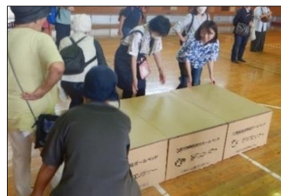
地域防災拠点運営訓練の様子