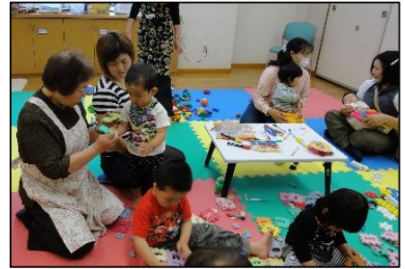
「すくすくかめっ子」で親子が楽しむ様子