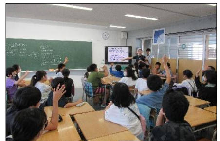
子安小学校での出前教室の様子