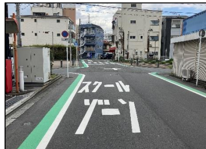
通学路 路面標示の補修