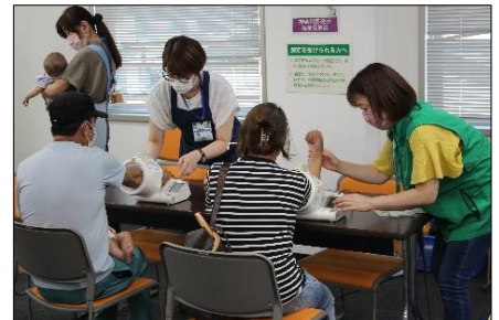
健康チェックの様子