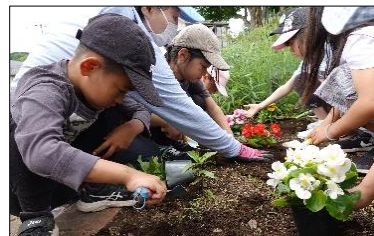
小学校と愛護会の連携による花壇づくり