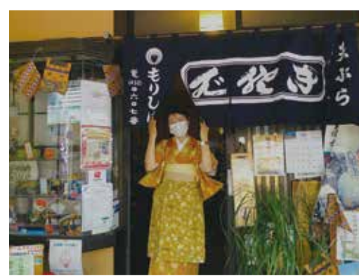
(撮影地:大口通商店街)