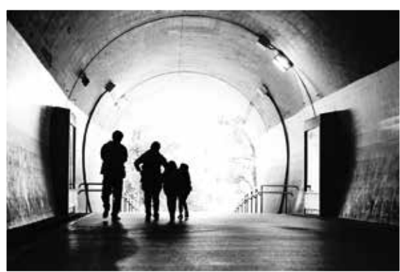
(撮影地:高島山トンネル)