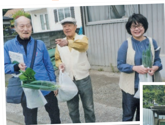
「ベジMAPづくりGOGO!」の運営委員として、学級内容を考えるために、区内の野菜直売所を巡りました。

生 涯学級受講をきっかけに夢を具体的に思い描くことができました。将来は、家を使って地域の人が気軽に出入りできる居場所をつくるのが夢です。