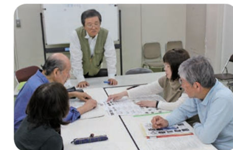
「健康の種」の皆さん

50代~80代の男女7人が企画・運営をしています。健康には興味があるけれど一人ではなかなか続かない、自分自身の体の状態や健康法を知りたい。そんな人が楽しみながら続けられる「健康の種」を集めた学級です。平成29年度のテーマは「未病」。健康長寿のまち神奈川県を目指して、10月から2期目の学級を企画しています。