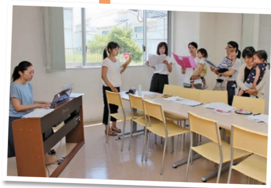
「かながわママコース マミムジカ」練習の様子 (沢渡三ツ沢地域ケアプラザ) ※一緒に歌ってくれるメンバーを募集しています。【マミムジカ】検索

孤 立しがちな子育て中の親が地域の中でつながり、育児の悩みを共有したり、歌うことでリフレッシュしたりできればと思い、運営委員のメンバーと一緒に自主活動サークル「マミムジカ」を立ち上げました。地域のボランティアの協力で、練習中の保育をお願いしていますが、お世話になった「すくすくかめっ子*」の担い手の人がボランティアとして支えてくれています。つながりが広がるのもうれしいですね。