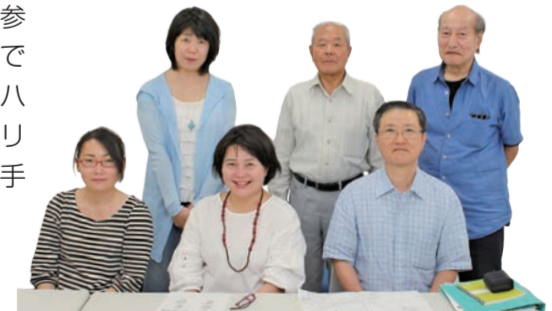
「ベジMAPづくりGOGO!」の皆さん

40代~70代の男女8人が企画・運営をしています。農家と区民をつなぎ、区内産の美味しい野菜をもっと食べてもらいたい、という思いから立ち上がりました。1期目の学級は区内の野菜直売所地図「ベジMAP」を全員参加のワークショップ形式で作ります。地図作りのイロハや楽しさをプロに学び、オリジナルの地図をあなたの手で作ってみませんか？