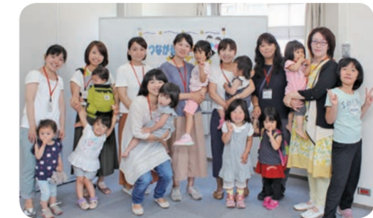
「つながるちからを育てよう」の皆さん

子育て中のママ10人が企画・運営をしています。周囲からは分かりづらいですが、母親が孤独や悩みを感じながらも一人で子育てしているケースがあります。一人で頑張らず、夫婦、家族、地域…みんなで大切な命を育てていきたい、周りにつながる力を育み、地域で見守られながら安心して子育てできるまち神奈川県を目指して、6月に3期目の学級「つながるちからを育てよう」を実施しました。