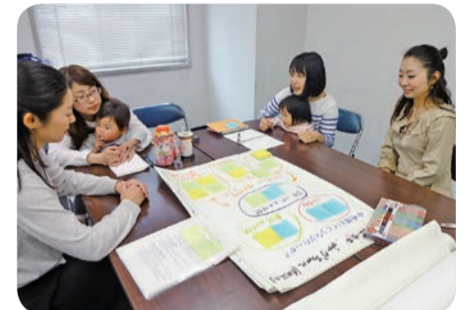
「ママカレッジ」の皆さん

子育て中のママ6人が企画・運営をしています。子育て中だから…と自分の時間をあきらめず「何か始めたい！地域に仲間が欲しい」そんな皆さんを応援する学級です。10月から2期目の学級を実施予定で、テーマはズバリ「時短!」。家事・育児をコントロールして、家族と地域の中で笑顔で過ごす時間を増やしませんか？現在、一緒に運営してくれる人を募集しています。