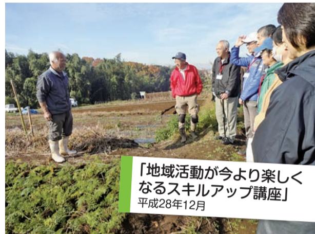
「地域活動が今より楽しくなるスキルアップ講座」 平成28年12月