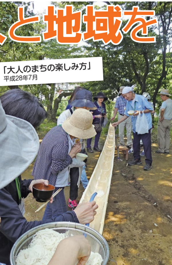
「大人のまちの楽しみ方」 平成28年7月