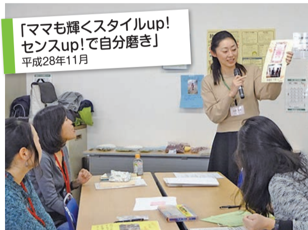
「ママも輝くスタイルup! センスup!で自分磨き」 平成28年11月