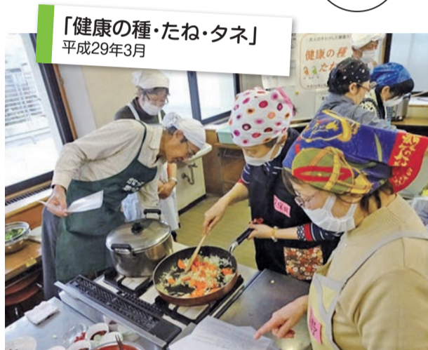
「健康の種・たね・タネ」 平成29年3月