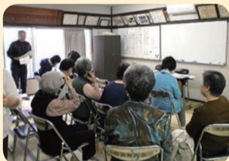
ふれあい活動研修会

日常的な関わりの中でさりげない見守りを行う「ふれあい活動」の取組を進めています。昨年度は、地域の中の見守りの「目」を増やすことを目的に、自治会町内会の役員をはじめとしたふれあい活動員を22人増員し、現在57人で見守り活動を行っています。また、民生委員・児童委員を中心にふれあい活動員の顔合わせ会やサロン、食事会を各自治会町内会で開催しています。さらに地区全体で活動員向けの研修を行うなど、支え合いの取組が広がっています。