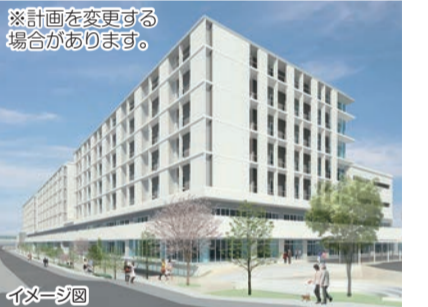
新市民病院 イメージ図

平成32年度の新病院開院に向け、診療棟の建設工事に着手します。高度急性期医療の充実を図るとともに、感染症医療や災害医療の拠点としての機能強化を図ります。 ●医療局病院経営本部再整備課 ☎331-1829