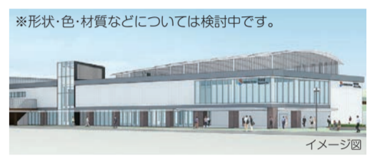
羽沢駅(仮称) イメージ図

「相鉄・JR直通線」は、平成31年度下期の開業に向け、JR線との接続部である横浜羽沢駅構内改修工事や軌道、建築、機械、電気工事を進めます。 「相鉄・東急直通線」は、平成34年度下期の開業に向けて、全区間で本格的に工事を実施します。 ●都市整備局都市交通課 ☎671-2722