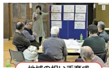
地域の担い手育成