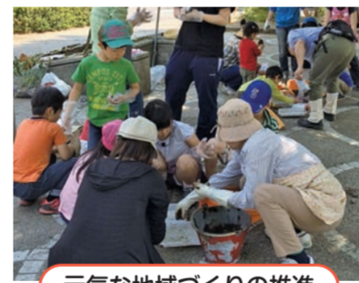
元気な地域づくりの推進

地域活動のすそ野を広げ、地域のつながりづくりやさまざまな課題を地域で話し合う場づくりに取り組めます。また、地域活動を支える担い手の育成を地域の皆さんと協働で進めます。