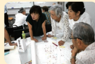
地区に14ある全自治会町内会で要援護者マップを作成

商業地から住宅地まで、幅広い表情を見せる地区です。東日本大震災時には地域が協力して要援護者の安否を確認した経験から、「日常的な見守り・支え合いから災害にも強い町をつくろう」を目標に取組を進めています。昨年は、全自治会町内会で要援護者マップを作成しました。また、町によっては、「災害時に支えてほしい人」と「支えることができる人」のアンケートを実施し、顔合わせが行われるなど、互いに顔の見える関係づくりに力を入れています。