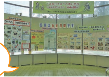
昨年の食育展の様子