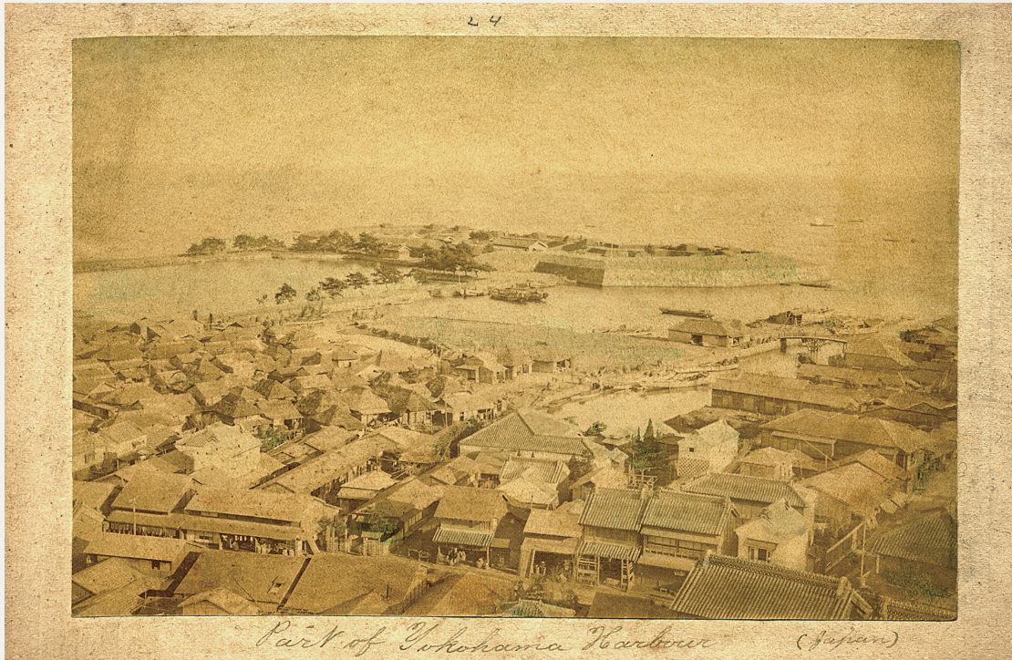
▲「神奈川台場を望む」

幕末、開港当時の神奈川区の海には港を守る砲台「神奈川台場」が築かれていました。旧東海道から滝の川沿いに海の方へ向かい、現在のJR貨物線付近に位置していたといわれています。扇形に海へ突き出した独特の形で、周囲の埋め立てが進んだ現在は、星野町公園などで石垣の一部を見ることができます。