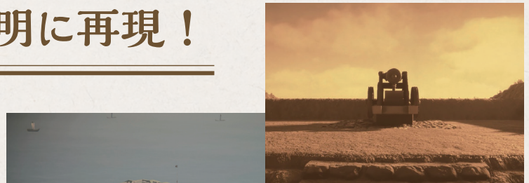
◀郷土学習映像の一部