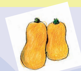
バターナッツカボチャ