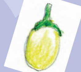
グリーンアツプル