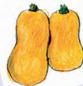
バターナッツカボチャ