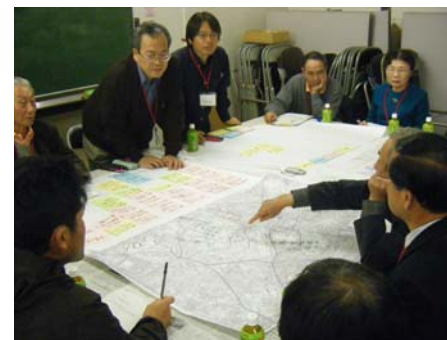
Aグループの作業風景