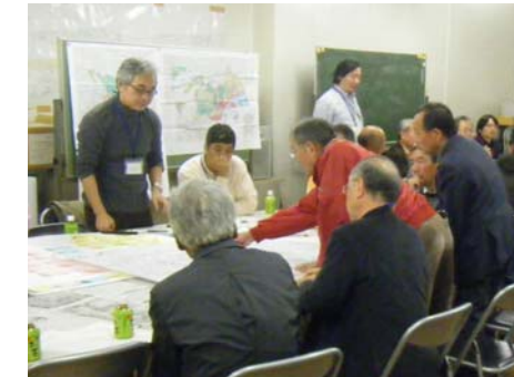
Bグループの作業風景