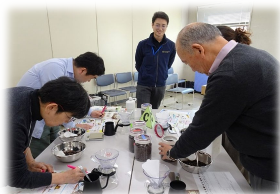
【C】 仲良し分かち合いブレンド