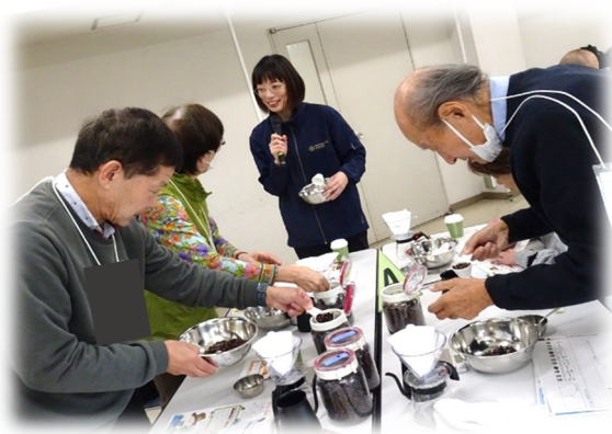
【A】 コクがあって優雅なブレンド