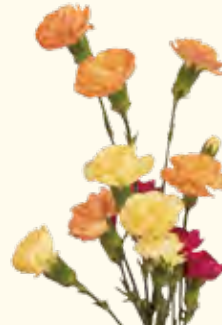
カーネーション 1本165円

☎ 045-421-2235 🏠 大口通31 大口駅・子安駅から徒歩7分 🕒 8:00~19:00 📅 なし