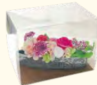
プリザーブドフラワー 6,600円

☎ 045-432-8711 🏠 大口通127-2 大口駅から徒歩3分 🕒 9:00~19:00 📅 不定休