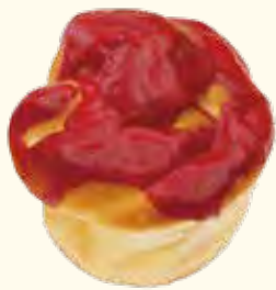
ローズブレッド 302円

☎ 045-491-8856 🏠 平川町10-2 東白楽駅から徒歩8分 🕒 7:00~19:00 📅 土曜日