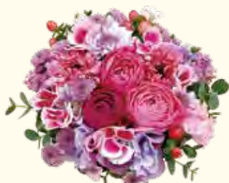
季節のアレンジ 3,000円~

☎ 045-432-8711 🏠 大口通127-2 大口駅から徒歩3分 🕒 9:00~19:00 📅 不定休