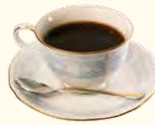
花柄カップでいただくコーヒー 500円

☎ 045-431-7032 🏠 大口通20-6 オオミヤビル1F 子安駅から徒歩3分 🕒 10:00~16:00 📅 土曜日・日曜日・祝日