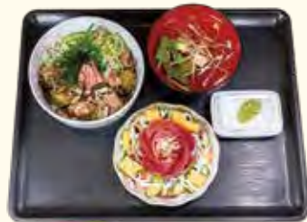
バラちらし 百花繚乱 1,290円

☎ 045-900-5880 🏠 松本町2-13-3 反町駅から徒歩2分 🕒 麺めし処 7:00~15:00 (L.O.14:30) ほっこり居酒屋 17:00~翌1:00 (土・祝前日 17:00~翌3:00) 📅 麺めし処 火曜日・水曜日 / ほっこり居酒屋 火曜日