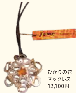
ひかりの花 ネックレス 12,100円

☎ 045-434-0091 📍 六角橋1-9-23 白楽駅から徒歩3分 🕒 11:00～20:00 🚗 不定休・ホームページにてご確認ください。