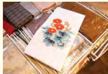
古着の紬・着物類 10,000円～

☎ 045-430-5980 📍 六角橋1-8-22 白楽駅から徒歩5分 🕒 10:00～19:00 🚗 不定休