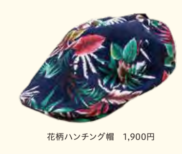
花柄ハンチング帽 1,900円

☎ 045-432-4123 📍 六角橋1-7-19 白楽駅から徒歩1分 🕒 10:30～19:30 🚗 不定休