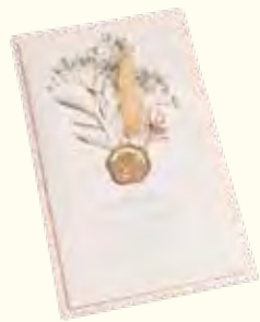
ドライフラワー付きパースデーカード 506円

☎ 045-432-1161 🏠 七島町128 子安駅から徒歩1分、 大口駅から徒歩10分 🕒 10:00~18:00 📅 日曜日・祝日・不定休