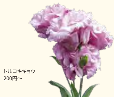
トルコキキョウ 200円～

☎ 045-433-7616 📍 六角橋1-8-21 白楽駅から徒歩5分 🕒 11:00～17:30、日曜 10:00～14:00 🚗 なし