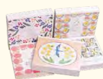
お花のブロックメモ 1個550円

☎ 045-402-1215 📍 六角橋1-7-21 白楽駅から徒歩2分 🕒 13:00～18:00 🚗 月曜日・火曜日