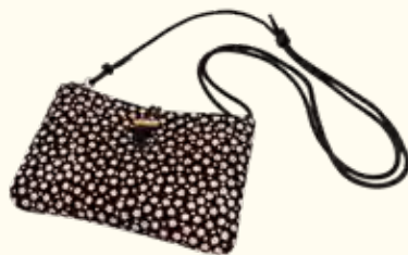
携帯ポーチ(花柄) 2,200円

☎ 090-4964-9045 🏠 七島町128 子安駅から徒歩2分、 大口駅から徒歩12分 🕒 10:00~18:00 📅 水曜日・第三日曜日