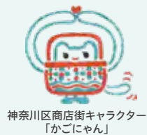
神奈川区商店街キャラクター 「かごにゃん」

協賛企業 株式会社カリタ／太陽油脂株式会社／株式会社ニッポン／花Lab.Nocturne 羽沢横浜国大店／三本珈琲株式会社