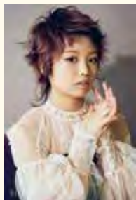
花をテーマにしたヘアカラー各種 7,700円～

☎ 045-401-3237 🏠 六角橋1-2-8 白楽駅から徒歩4分 🕒 10:00～19:00 📅 火曜日