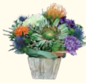
お花のアレンジメント 3,000円～ (写真参考価格: 3,850円)

☎ 045-491-2757 🏠 広台太田町8-1 反町駅から徒歩8分 🕒 9:00～18:00 📅 木曜(基本定休) 行事等により営業日有り。要ご確認ください。