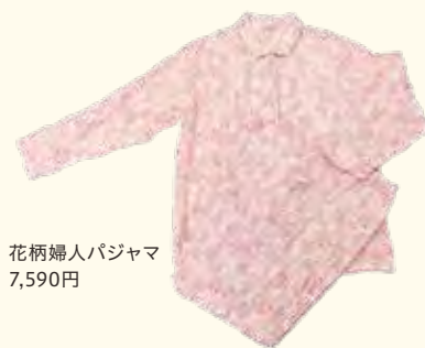
花柄婦人パジャマ 7,590円

☎ 045-402-1215 📍 六角橋1-7-21 白楽駅から徒歩2分 🕒 13:00～18:00 🚗 月曜日・火曜日