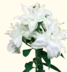
八重咲きオリエンタルリリー 1,300円〜

☎ 045-431-8882 📍 六角橋1-9-22 白楽駅から徒歩4分 🕒 11:00~18:00 📅 日曜日