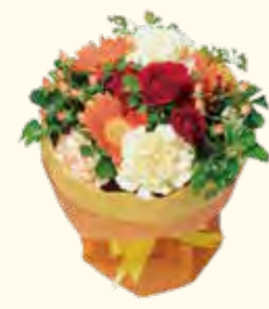
黄色のスタンディングブーケ 2,500円～

☎ 045-482-0187 🏠 西神奈川3-7-3 白楽駅・東白楽駅から徒歩5分 🕒 10:00～19:00、日曜 10:00～18:00 📅 木曜日