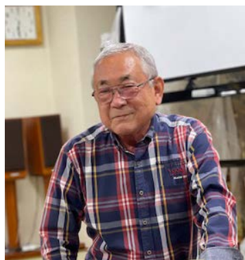
▲町内会役員の若い世代から学ぶことが多いと言う石渡会長

緊急時の町内の情報発信にデジタル活用した取組を、町内会の役員の方々にお聞きしました。