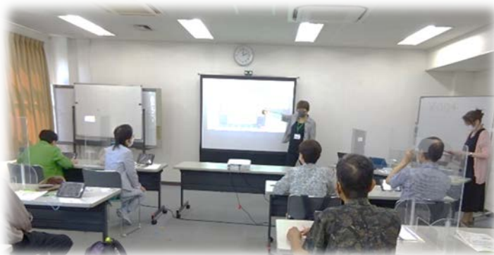
熱心に話を聴く受講者のみなさん

講師は助っ人BANK登録団体の認定NPO法人かな がわ311ネットワークさん。新型コロナウイルス の影響で導入がすすんだZoomの使い方を分 かりやすく説明していただきました。 当センターでは、今後も利用登録団体、助っ 人BANK登録者向けのスキルアップ研修や交流 会を通して、活動を応援していきます。