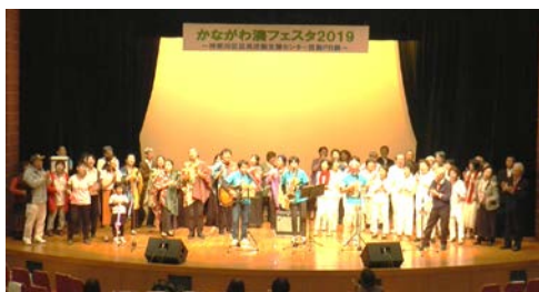
かながわ湊フェスタ2019の様子