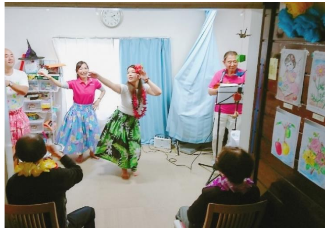
[楽しさと一体感を感じられた慰問]

私自身ボランティアを始めてまだ日は浅いですが、大事にしていることがあります。それは、その場にいる人全員と一緒に楽しい時間を過ごしてもらうことです。これからボランティアをする人にもこの想いを伝えられたらいいなと思います。 (記：区民活動支援センター職員 山下)