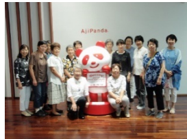
味の素工場見学の様子