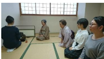
和室での練習の様子

10月20日は、「茶の湯×オカリナ×ケアプラザ」と題して世界の子守唄をオカリナ演奏で聞きながら、お茶をいただきました。小さなお子様連れのお母さん、毎回楽しみにしている高齢者の方々もオカリナ演奏に合わせて歌いながら楽しんでいました。