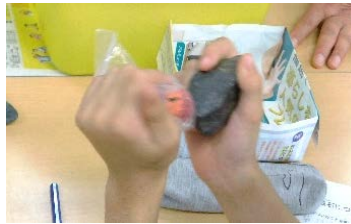
石は磁石にくっつくかな?

砂鉄と磁石を使って磁場を学んだり、絵を描いたり。はじめは緊張していた子どもたちはどんどん夢中になっていき、自然に「なぜ?」「どうして?」と好奇心が湧いてきた様子。目の前に現れる現象に目を輝かせていました。 (10/6 神大寺地区センター)