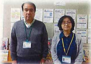
野澤館長とスタッフさん

他にキッズのダンスグループから子育てグループそしてシニアの写真グループまで幅広い層が活躍しています。