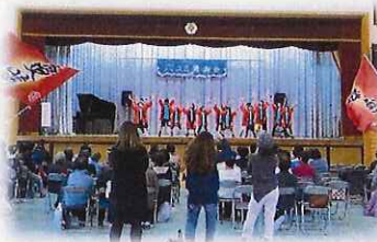
六コミ発表会は盛り上がりました♪

神奈川県区内には3つの学校コミュニティハウスがあります。その一つが港北区との区境、岸根公園の近くにある六角橋中学校コミュニティハウスです。利用者は近隣の六角橋、神大寺・片倉町の方が多いそうです。「六コミ」の愛称で呼ばれています。