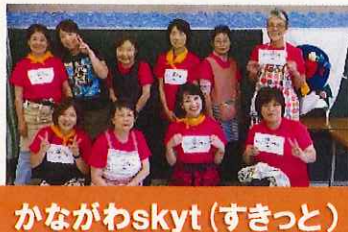
かながわskyt(すきっと)