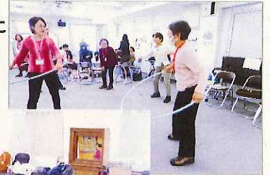
三ツ沢グッチ さん熱演