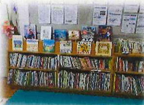
絵本がたくさんありますよ。