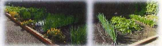
元気に野菜が育っています！