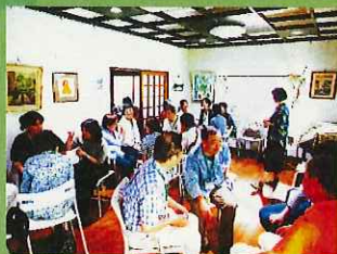
☆「大人のまちの楽しみ方」

☆地域デビュー講座や★助っ人BANK(街の先生)の講師による講座、登録者・団体向けの交流会、スキルアップ講座など開催中。