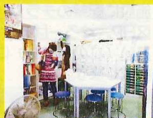
〈ミーティングスペース〉