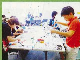
★「夏休み親子で自由研究」