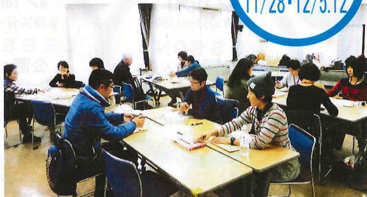
畑を見学後のワークショップ。自分の活動の悩みも共有しました。