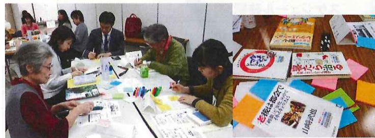
本を使ってのコミュニケーションは初めての同士での話が弾みました♪