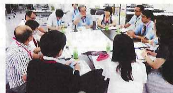
前回の連携会議の様子

施設同士の交流、新たな連携の可能性を探り、各施設から地域を元気にするためのきっかけ作りに、区民活動支援センターでは「神奈川区地域施設間連携会議」を行っています。自治会・町内会活動、子育てや介護など地域課題の解決を支援するために各施設の得意分野を活かし連携することで、「ずっと住みたいまち神奈川区」を目指します。