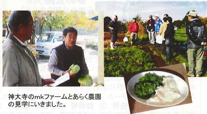
神大寺のmkファームとあらく農園の見学にいきました。