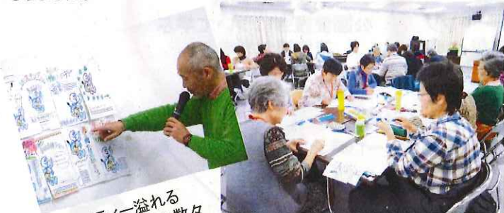
オリジナリティー溢れる チラシの数々