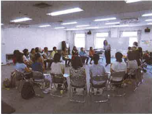
第2回 みんなでトーク～イライラの合図を知ろう～

大好評「つながるちからを育てよう」の第3弾です！ 1番大切な人だからこそわかってほしい。 わかってあげたい。 そんな思いから生まれた講座です。 6月18日(日)父の日の第3回講座では、 パパも半数以上参加しました。 子育て期だからこそ夫婦間で協力して 子育てをするための コミュニケーション術などを 学びました。