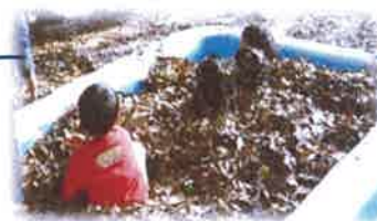
【昨年の落ち葉プール】

日程: 12月1日(金) / 2日(土) / 3日(日) 時間: 午前11時～午後2時迄 場所: 三ツ沢公園 第一レストハウス前 ★3日(日)は焼き芋作りもします! (有料)