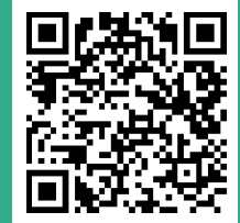
神奈川区保育所等施設一覧