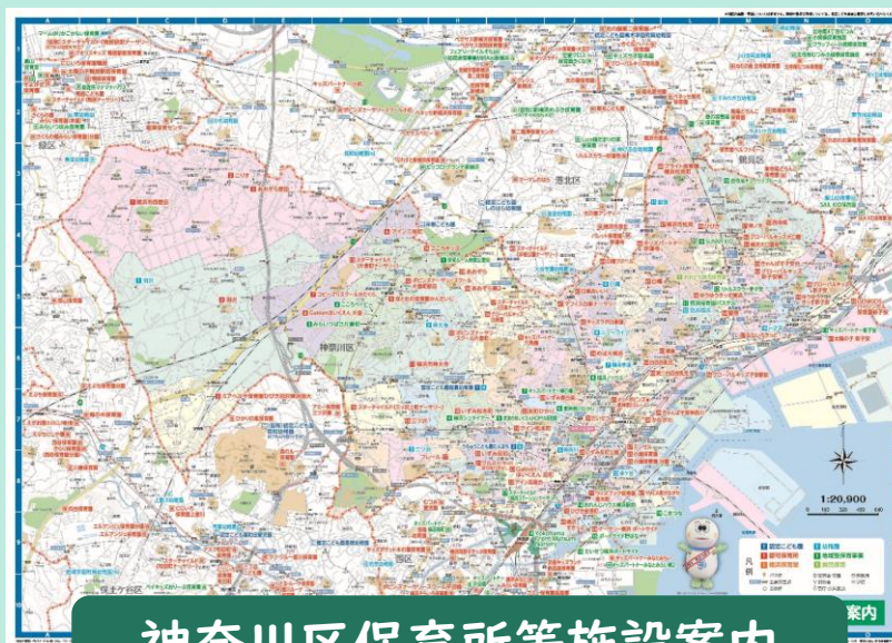
神奈川区保育所等施設案内