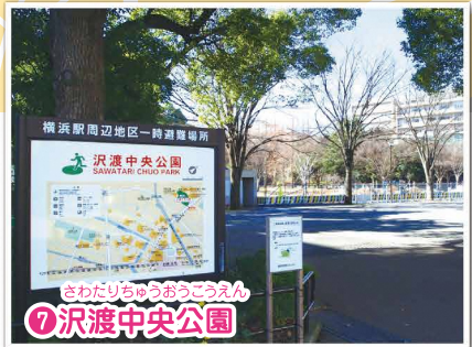
さわたりちゅうおうこうえん ⑦沢渡中央公園