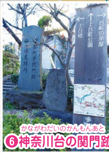
かながわのいのかんもんあと ⑥神奈川台の関門跡