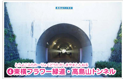
どうよこふらわーりょうどうたがしまやとんねる ④東横フラワー緑道・高島山トンネル