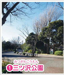
みつざわこうえん ①三ツ沢公園