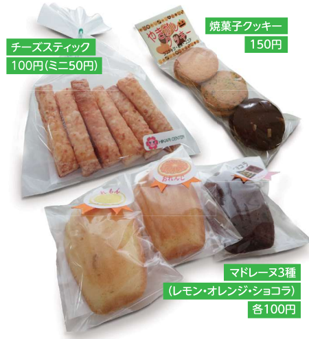
チーズスティック 100円(ミニ50円)