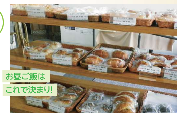
お昼ご飯は これで決まり!