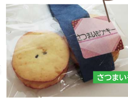
さつまいもクッキー 100円