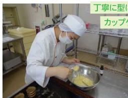
丁寧に型に流し込む カップケーキ作り