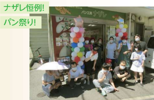
ナザレ恒例! パン祭り!

各作業工程のスペシャリスト(生地丸めが上手、計量が得意、袋詰めが上手、接客が得意など)があり、毎日精一杯愛情を込めて作っています。