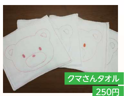
クマさんタオル 250円