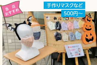
手作りマスクなど 500円～