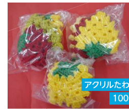
アクリルたわし 100円