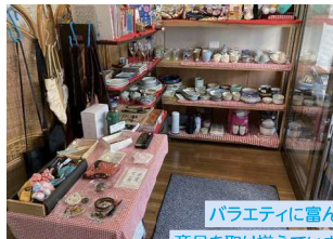
バラエティに富んだ 商品を取り揃えています

利用者の方や保護者の心がこもった 自主製品やバザー品を各種取り 揃えております。またバザー品の 持ち込みも歓迎です。