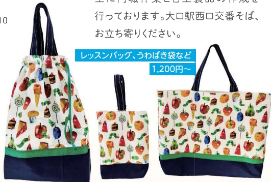
レッスンバッグ、うわばき袋など 1,200円～