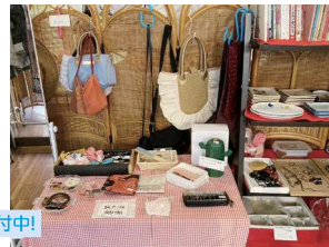
バザー品の 持ち込みも受付中!