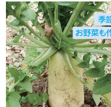
季節の新鮮な お野菜も作ってます!