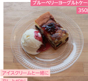
ブルーベリーヨーグルトケーキ 350円