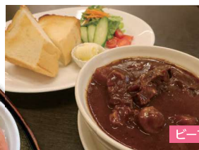
ビーフシチュー 890円