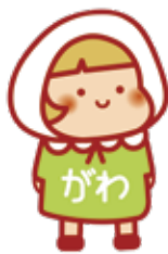
かながわ支え愛プラン キャラクター がわちゃん

社会福祉法第107条・109条に基づき、横浜市では、 市・区役所、市・区社会福祉協議会、 地域ケアプラザ・地域包括支援センターや地域のみなさんが協働して、 市計画・区計画・地区別計画を策定しています。