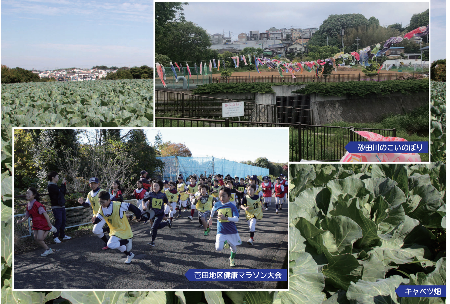
砂田川のこいのぼり