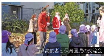
高齢者と保育園児の交流会