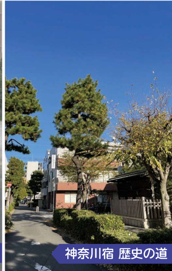
神奈川宿 歴史の道