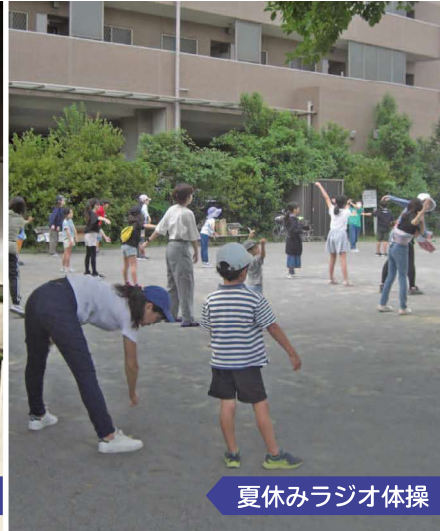
夏休みラジオ体操