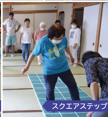
スクエアステップ