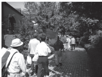
「みんなで元気に歩け歩け」

地区の5町内会（地区社協）が一緒になって、地域の「みまもり」や「つながり」を育む様々な活動が行われています。今後も地区連合の定例会等の場を活用して、現行の取組をさらに推進させていきます。