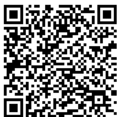
参加申込フォーム