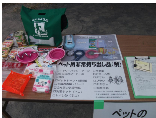
＜地域防災拠点でのペット同行避難実施状況＞