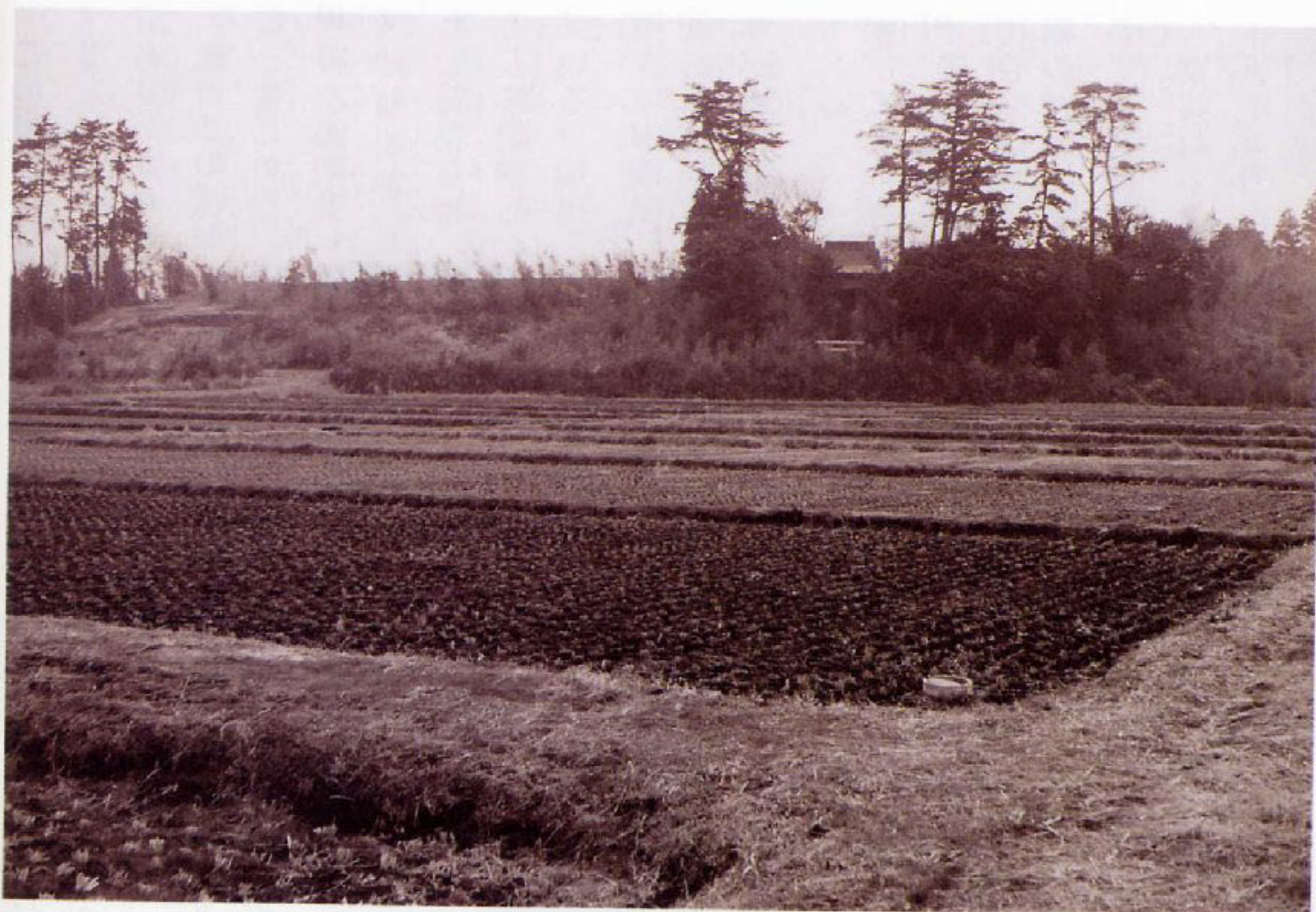
団地造成前の神明神社周辺

市営上飯田団地の造成には、神社周辺の丘陵部を切り崩して低地の水田を埋めるといった工法がとられた。現在なら鎮守の森を存続させるために社殿を残したまま廻りを削り取るという造成方法も取れたと思うが、昭和三十八年代の社会環境下では無理であった。昭和四十一年三月四日、神