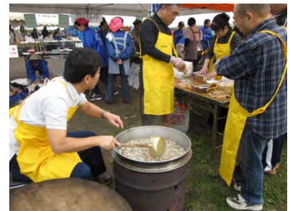
キズーナ (緑園地区)