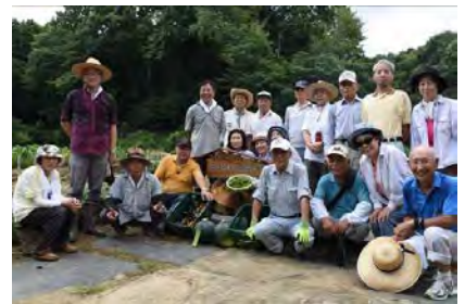
里山プロジェクト (中川地区)