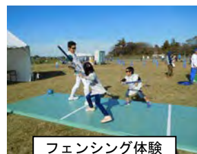
フェンシング体験