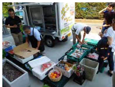
ほかほかマーケット (下和泉地区)