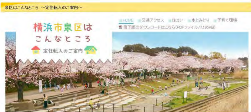
〈定住転入促進ウェブサイト TOP ページ〉

泉区の農畜産物や直売所等を暮らしの視点で紹介する『泉味（いずみ）ページ』を平成31年1月に追加しています。