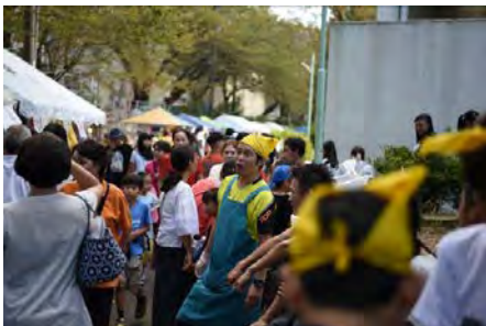
多文化まちづくり工房 (いちょう団地地区)