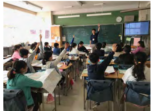
防災出前講座の様子（岡津小）