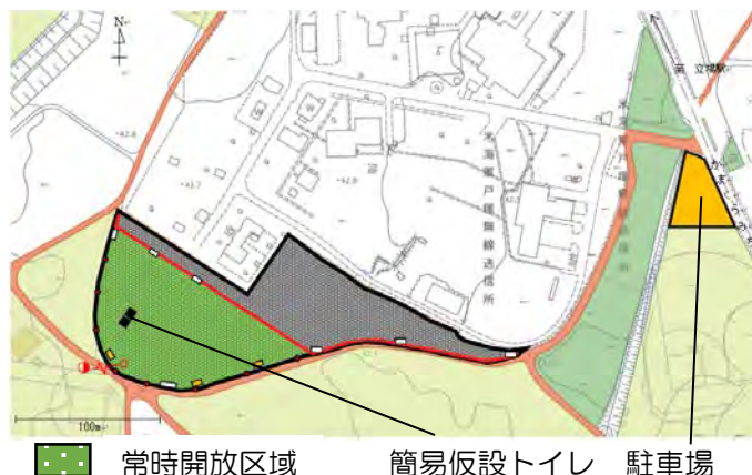
常時開放区域 簡易仮設トイレ 駐車場