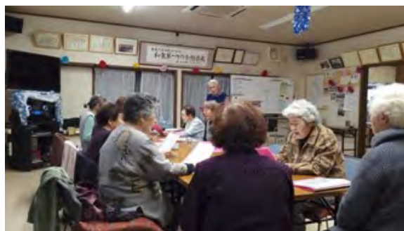
↑ 高齢者サロンで馴染みの顔に再会