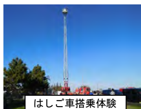
はしご車搭乗体験