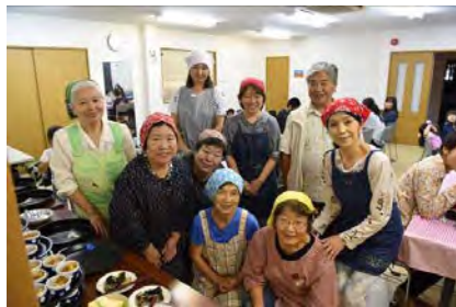
コミュニティ新橋食堂 (新橋地区)