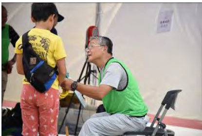
体力測定 (和泉北部地区)