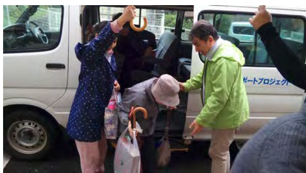
↑ 住民の方と施設職員で乗降のお手伝い

※泉サポートプロジェクト：泉区社会福祉協議会の会員組織である専門機関部会の会員である社会福祉法人等が、「地域貢献・公益的活動」の様々な取組を実施又は検討することを目的としたプロジェクト