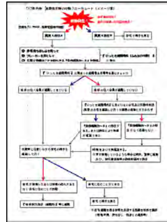
町の防災組織マニュアル（仮称） （震災時の行動フローチャート）