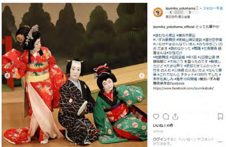
〈泉区公式インスタグラム〉

泉区に暮らす魅力の視点で、友人や周囲の方へ口コミで伝わって欲しい情報を掲載しています。