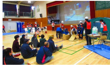
地域防災拠点での訓練