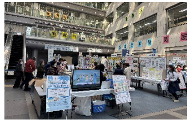
泉わくわくプラン推進イベント