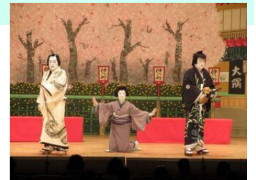
横浜いずみ歌舞伎

・令和7年5月全市プランの改定を踏まえ、都市計画マスタープラン「泉区プラン」の改定に向けた検討