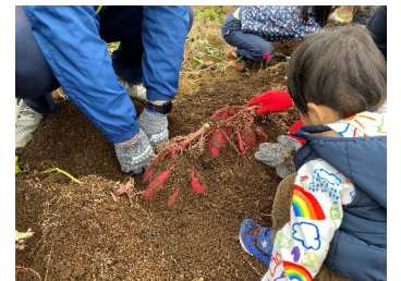
地産地消体験イベント