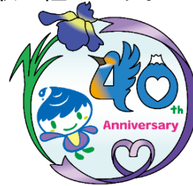
泉区制40周年記念ロゴマーク

令和8年は、泉区制40周年という大きな節目の年です。また、翌年3月には、いよいよ横浜グリーンエクスポが開幕します。地域の絆の深化、未来への期待感を高める取組と、横浜グリーンエクスポの来場意欲の醸成等に泉区一丸となって取り組みます。