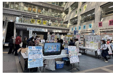
泉わくわくプラン推進イベント