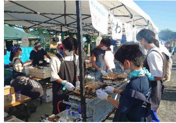
泉わくわく応援隊