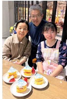
地元食材を使用した ケーキ作りイベント