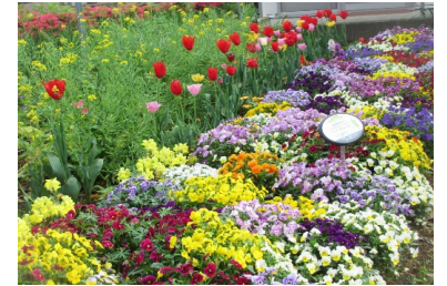
愛護会による花壇づくり