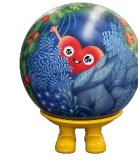
公式マスコットキャラクター トウキョウトウンク