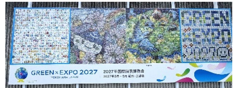
区内小学校による機運醸成の取組

区民・団体・企業の皆様、行政が一体となり、令和8年12月まで様々な取組を行います