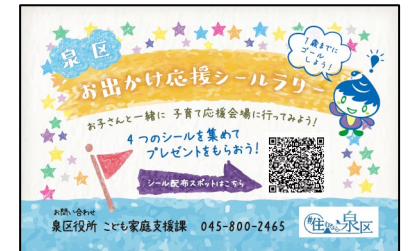
泉区お出かけ応援シールラリー