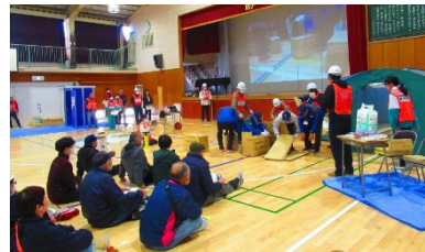
地域防災拠点での訓練