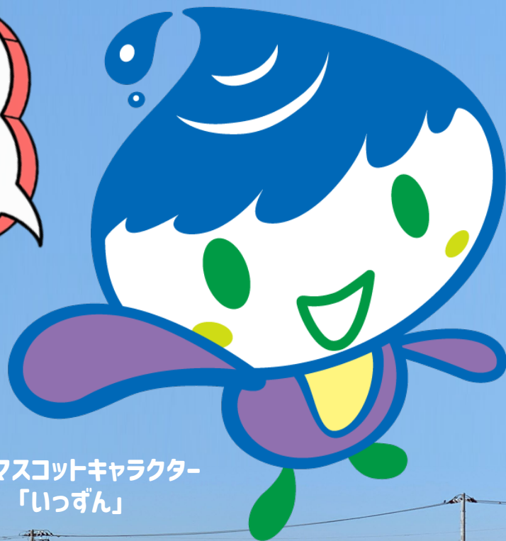
泉区マスコットキャラクター 「いっずん」