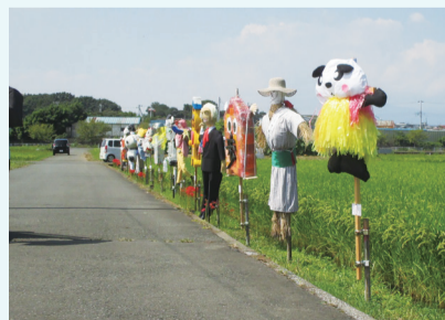
個性豊かな桑山子

富士見が丘連合自治会では、家内安全・交通安全を願う昔ながらの「どんど焼き」、健康づくりの一環としての「新春マラソン&ウォーキング」、そして、「桑山子コンテスト」など、多彩なイベントを開催し、地域交流を図り、絆を深めています。