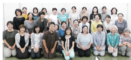
赤ちゃんに会って元気をもらっています