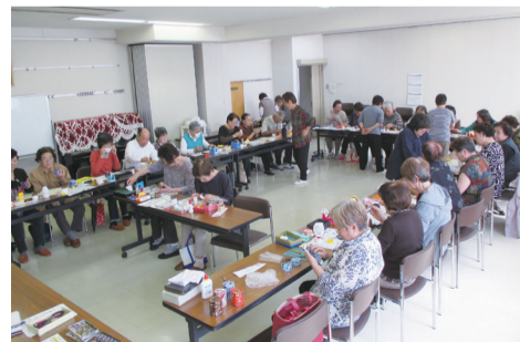
「いちようサロン」での小物作り