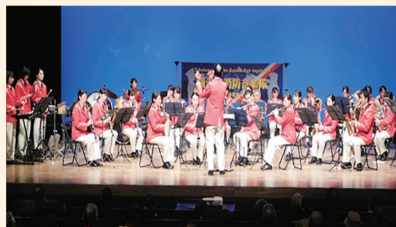
昨年のいずみ防災講演会(消防音楽隊の演奏)の様子