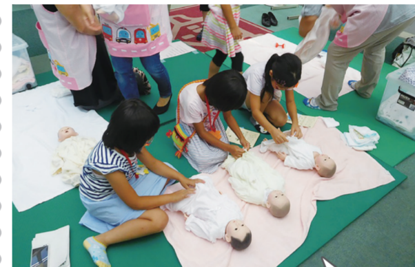
新生児人形を使って、赤ちゃんのお世話を体験(泉区子どもアドベンチャーで)

赤ちゃんを大切にしようという感情は、生まれながらのものではなく、赤ちゃんと実際に触れ合うことで育っていくものと分かってきました。泉区では赤ちゃんとのふれあい体験を進めています。