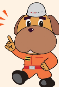
横浜消防マスコット キャラクター「ハマくん」