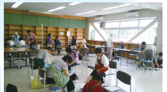
「福祉まつり」での健康チェック