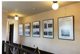
ベーリックホール(中区)でのフォトコンテスト展示の様子