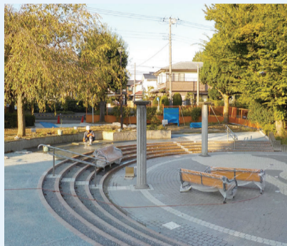
西洋風な雰囲気を漂わせる緑園須郷台公園。石畳などこの公園の特徴を活かしたリニューアル工事を行っています。