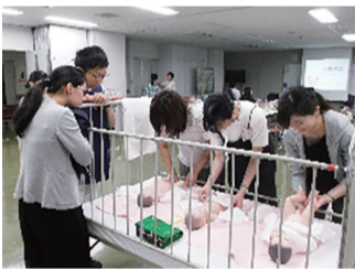
お父さんの妊婦体験

妊娠中の人や赤ちゃんのお父さんが、妊娠・出産・子育てについての基礎知識を学びます。同じころに赤ちゃんが生まれる人が集まりますので、同じ地域の友達をつくるよいチャンスでもあります。