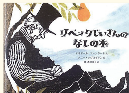
テオドール・フォンターネ 文 ナニー・ホグロギアン 絵 藤本 朝巳 訳【岩波書店 2006年】