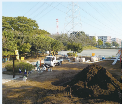
明るく開放的になったいずみ台公園ログハウス周辺。引き続き多目的広場などの工事を実施します。

工事内容や公園が利用できない期間は、各公園に掲示しますのでご覧ください。工事期間中はご不便をおかけしますが、安全で安心な公園にするため、ご理解ご協力をお願いします。