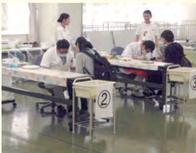
▲フッ素塗布の様子

☎5月24日(消印有効)までに、住所・保護者と子の氏名・子の年齢・電話番号を書いて、往復はがき(1世帯1通)かEメールで健康づくり係へEメールの件名は「子どものフッ素申込み」で