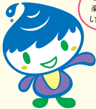
泉区マスコットキャラクター いっずん